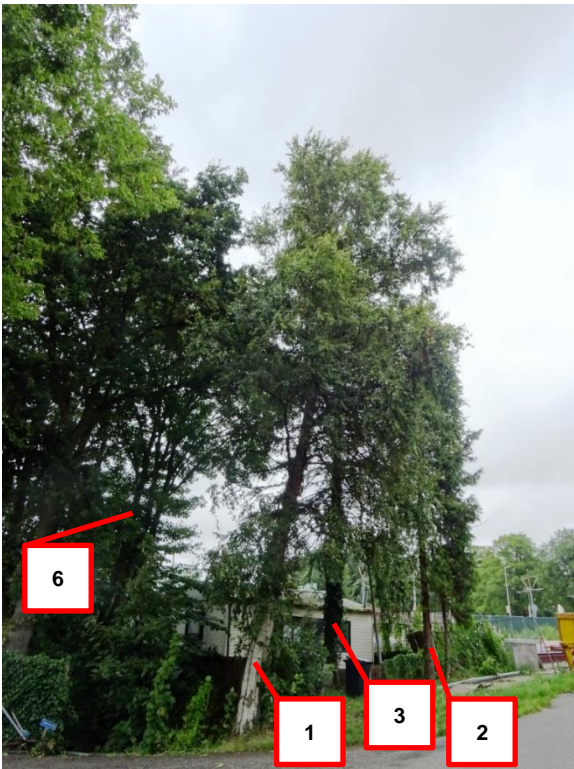
Aanzicht voortuin en zijtuin.